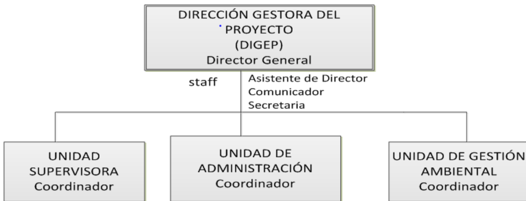
Ilustración N° 2 Organigrama de DIGEP