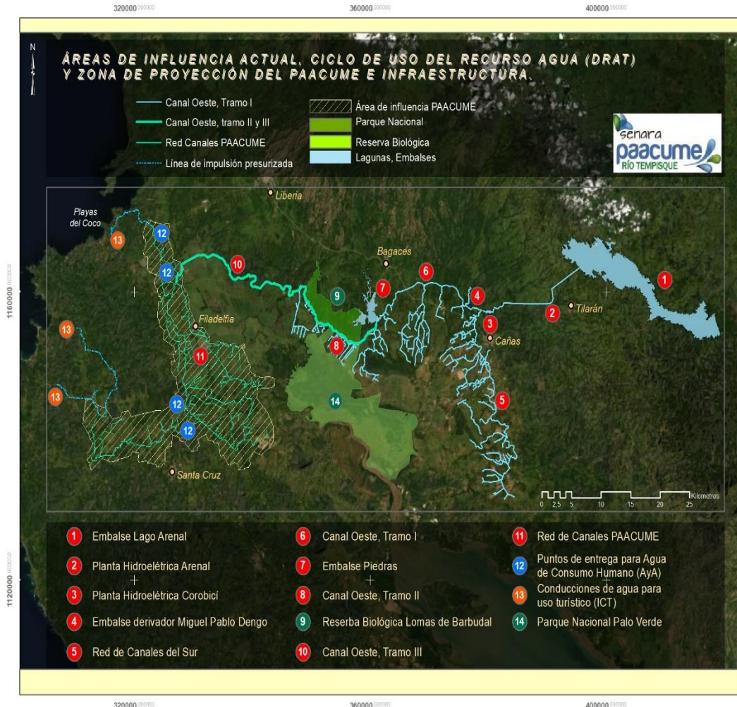
Ilustración N° 1 Esquema de PAACUME

El proyecto beneficiará de manera directa a productores agropecuarios, ubicados en los cantones de: Carrillo, Santa Cruz y Nicoya, así como a la población de dichos cantones de agua para consumo humano y riego para zonas verdes para proyectos turísticos. Entre los beneficiarios directos se encuentran productores grandes, medianos y pequeños. En esta última categoría se hace referencia, en su mayoría, a adjudicatarios en asentamientos campesinos, que se caracterizan por una mayor necesidad de apoyo por parte de las instituciones del sector agropecuario. El área de riego para la producción agropecuaria se estima en 18.639 podrían beneficiar 746 productores entre grandes,