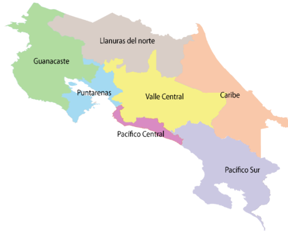
Figura 1 Unidades de planeamiento de Costa Rica.

Con la aplicación de una escala de estudio más precisa las unidades turísticas se subdividen, a efectos de aplicar programas particulares de gestión del espacio turístico, en sectores que abarcan un territorio formado por uno o varios distritos con gran concentración de actividades turísticas o en el que el turismo es una actividad potencialmente importante. Al igual que las unidades, no tienen significado en términos de mercadeo o promoción y solamente se establecen para facilitar el desarrollo de programas regionales de apoyo al turismo.