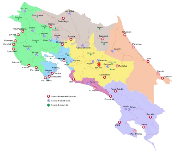
Figura 3. Distribución de los centros turísticos del país.