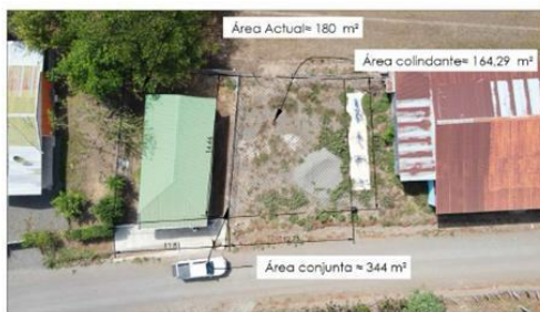
Figura 2. Fotografía aérea lote Lajas Coco

Lo anterior, se evidencia de las siguientes imágenes captadas de dicha área: