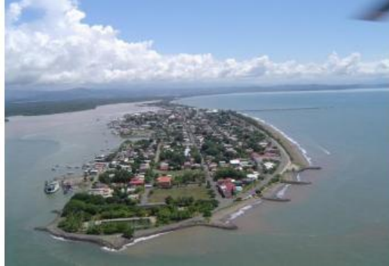
Imagen 1. Cantón central de Puntarenas

Se considera que el aumento de la población del cantón se dio luego de que se declarara a Puntarenas como Puerto Franco de altura para las exportaciones de café a Inglaterra y Chile en 1847, ayudado por la construcción del burro carril entre Barranca y Esparza y la construcción del ferrocarril entre San José y Puntarenas finalizado en 1910.